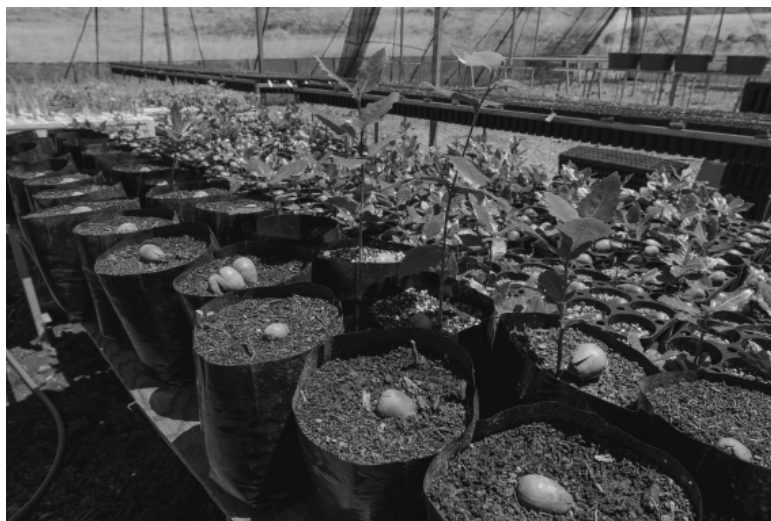
Foto 6. Producción de plántulas de especies endémicas y nativas en el vivero de Isla Guadalupe, proyecto puesto en marcha por el GECI con el apoyo de la Conafor, la Conanp y la Semar.

El GECI también ha incursionado en la restauración de las comunidades vegetales nativas, destacando el caso de Isla Guadalupe, donde se lleva a cabo un proyecto de restauración integral, en estrecha colaboración con el gobierno federal a través de la Conafor y la Conanp, y con el apoyo de la Semar. Este proyecto incluye la producción masiva en invernadero de plantas endémicas y nativas –como el ciprés de Guadalupe ( Cupressus guadalupensis ) y el encino insular ( Quercus tomentella )– en la isla, utilizando el banco de semillas ahí presente; así como el manejo de suelo, la remoción de material combustible y el mantenimiento de brechas cortafuego. Este proyecto es pionero a escala nacional, y un parteaguas en restauración forestal, que brinda una visión integral y alternativa a los esquemas tradicionales de reforestación.