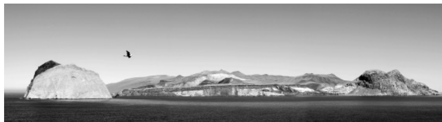
Foto 1. Vista panorámica de la punta sur de Isla Guadalupe y sus islotes.