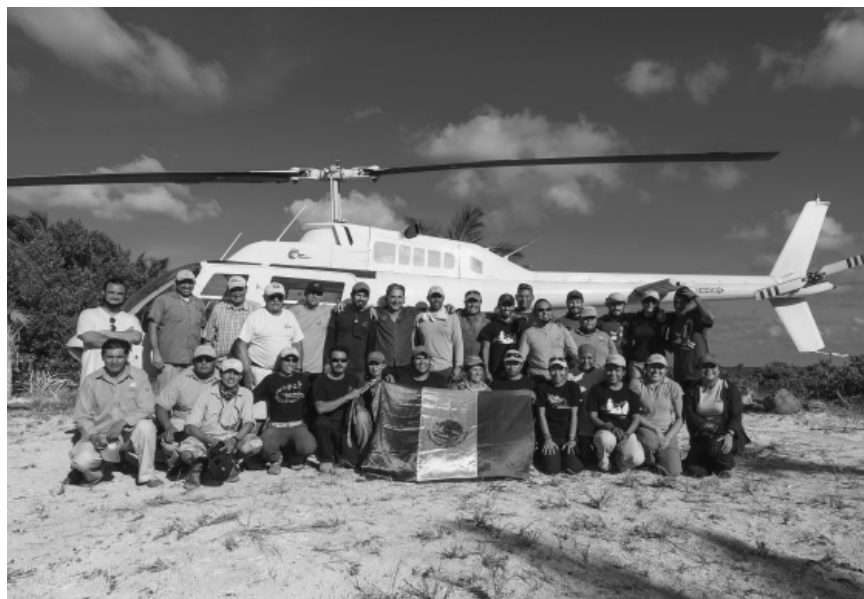
Foto 4. Colaboración interinstitucional (GECI, Conanp, Semar, Conabio, Alianza WWF-FCS, Fundación Packard, Fundación Marisla y NFWF) durante la ejecución del proyecto de erradicación de rata negra en las islas Cayo Norte Mayor y Cayo Norte Menor, parte de la Reserva de la Biosfera Banco Chinchorro, en abril de 2012.