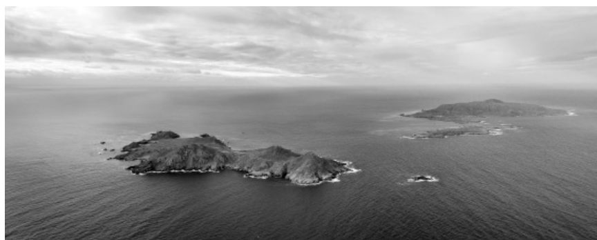
Foto 2. Islas San Benito, parte de la recién decretada Reserva de la Biosfera Islas del Pacífico de la Península de Baja California (DOF, 2016), donde más de dos millones de individuos de 12 especies de aves marinas anidan cada año.

Las islas son además clave para la soberanía nacional. Gracias a la localización de islas oceánicas como Guadalupe y el Archipiélago de Revillagigedo, México cuenta con la décimo tercera Zona Económica Exclusiva (ZEE) más grande en el mundo —3.1 millones de km 2 —, de gran beneficio económico para nuestro país por los recursos naturales