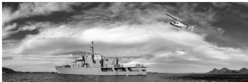
Foto 3. Buque ARM “BRETÓN” (PO, 124) de la Secretaría de Marina-Armada de México, dando apoyo logístico para la restauración ambiental de las islas de México –como un mandato amplio a favor del cuidado de la soberanía y el patrimonio natural nacional– durante el proyecto de erradicación del ratón invasor en la isla San Benito Oeste, en el Pacífico mexicano, ejecutado por el Grupo de Ecología y Conservación de Islas (GECI) en noviembre de 2013.

A pesar de su gran riqueza biológica, las islas han sufrido extinciones de especies de forma desproporcionada (Doherty et al. , 2016; Mulongoy et al. , 2006; Tershy et al. , 2015; Veitch et al. , 2011, entre otros). De las extinciones que se han registrado históricamente a escala mundial, 61% han ocurrido en islas, además de que en éstas se encuentra 37% de todas las especies en peligro crítico de extinción de acuerdo con la Lista Roja de la Unión Internacional para la Conservación de la Naturaleza (IUCN, por su nombre en inglés, 2017; Tershy et al. , 2015). De esta manera, las especies exóticas invasoras (EEI) son, por mucho, la causa principal de extinción de especies endémicas insulares (Early et al. , 2016; Simberloff