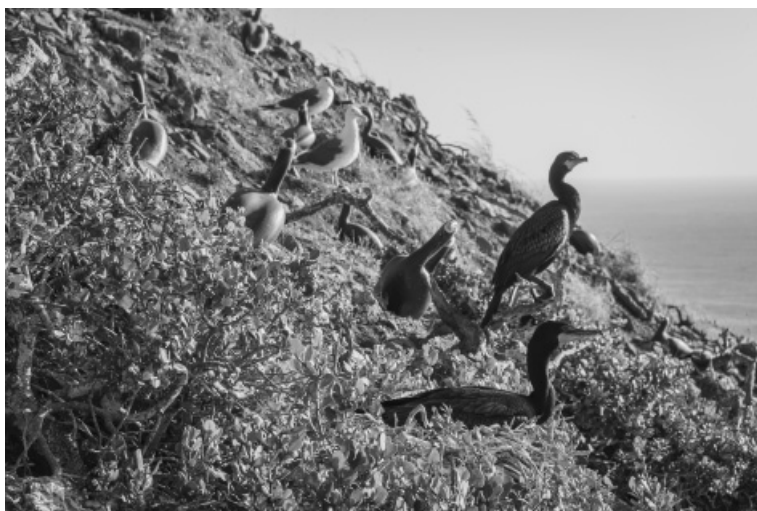
Foto 5. Cormorán doble cresta anidando entre la colonia de señuelos artificiales en la isla Todos Santos Sur, resultado de las acciones de restauración de aves marinas mediante técnicas de atracción social.

Por otro lado, la restauración activa de aves marinas por medio de vanguardistas sistemas de atracción social y de restauración de hábitat, también ha comenzado a rendir frutos. La atracción social –acción que en algunos casos se impone después de la erradicación de mamíferos invasores– consiste en recrear colonias de aves, por medio de señuelos, construyendo madrigueras artificiales y reproduciendo vocalizaciones. Estos proyectos, por su propia naturaleza adaptativa, deben tener una visión de largo plazo para generar resultados. No obstante, afortunadamente en nuestras islas, al cabo de unos cuantos años, ya se observan efectos positivos alentadores. En la isla Todos Santos Sur, por