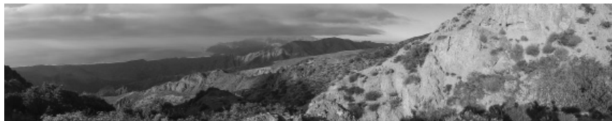
Foto 7. Vista panorámica de Isla Cedros, parte de la nueva Reserva de la Biosfera Islas del Pacífico de la Península de Baja California, donde habita una subespecie endémica de venado bura ( Odocoileus hemionus subsp. cerrosensis ).